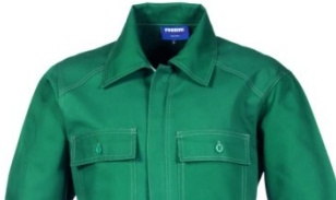
04 – VERDE