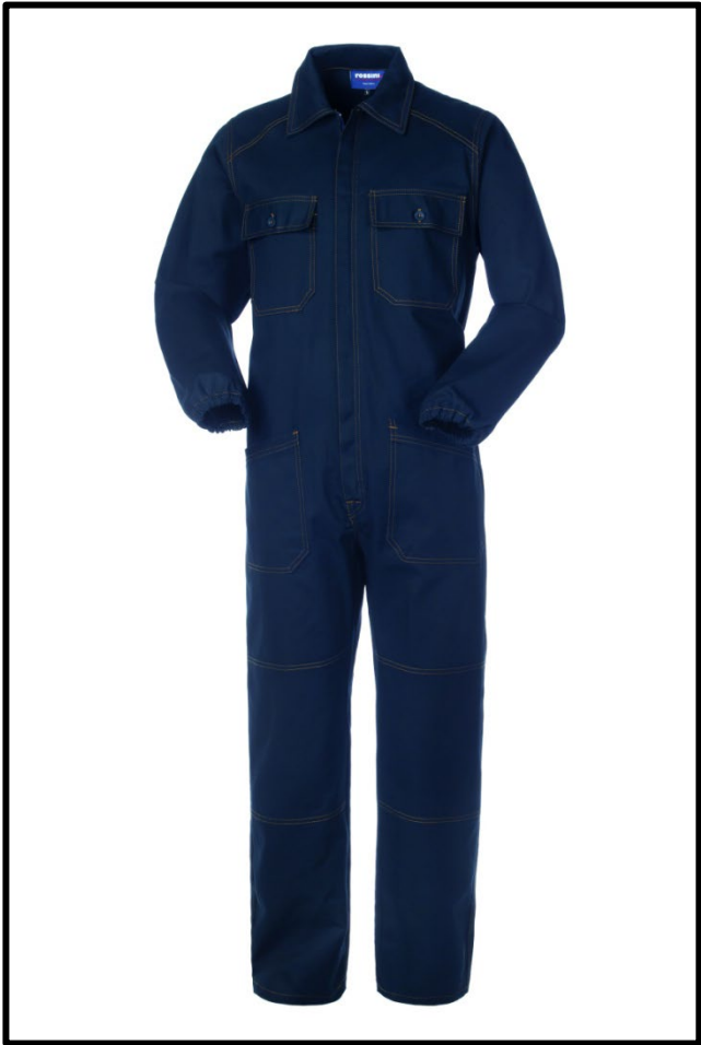
01 – BLU