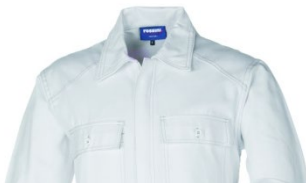
02 – BIANCO