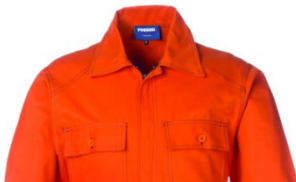
09 – ARANCIO