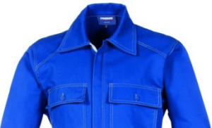
06 – AZZURRO ROYAL