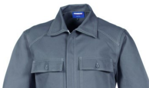
12 – GRIGIO