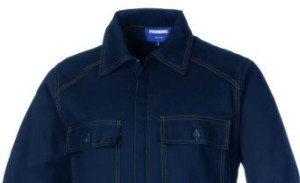
01 – BLU