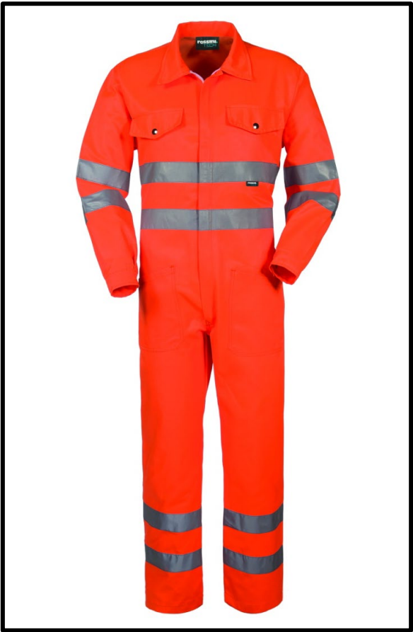
09 – ARANCIO