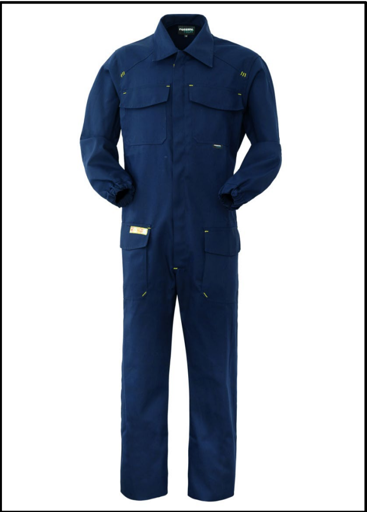
74 – SAILOR BLUE