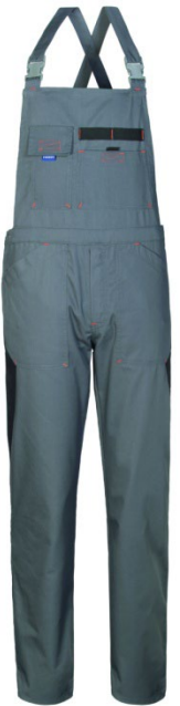
GY – GRIGIO/NERO