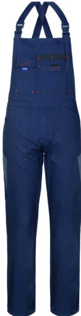
80 – BLU/GRIGIO