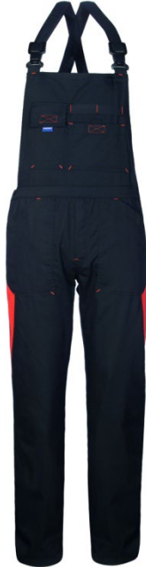
64 – NERO/ARANCIO