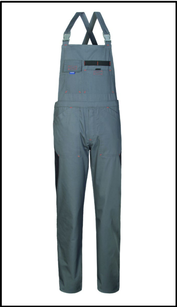
GY – GRIGIO/NERO