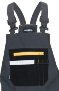
12 – GRIGIO