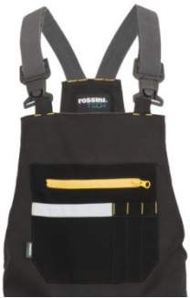
91 – WARM GREY