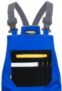
06 – AZZURRO ROYAL