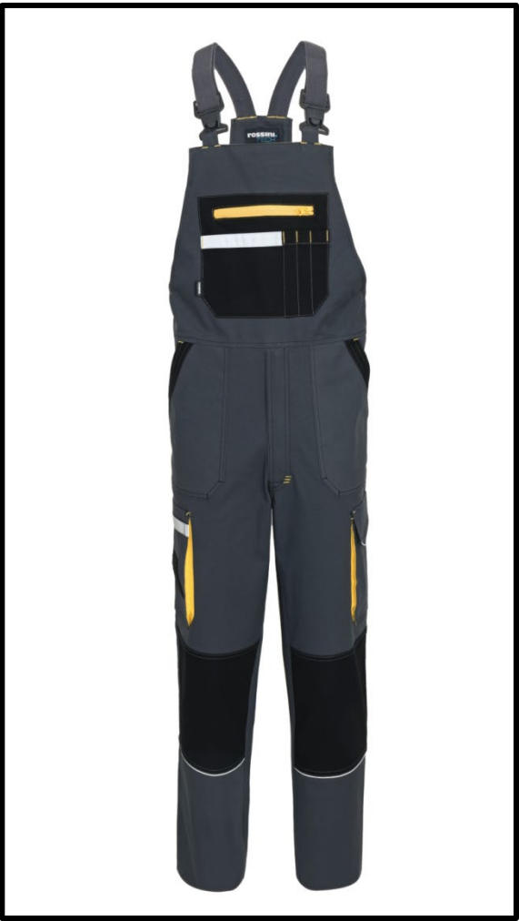
12 – GRIGIO