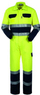
42 – GIALLO/BLU