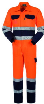
21 – ARANCIO/BLU