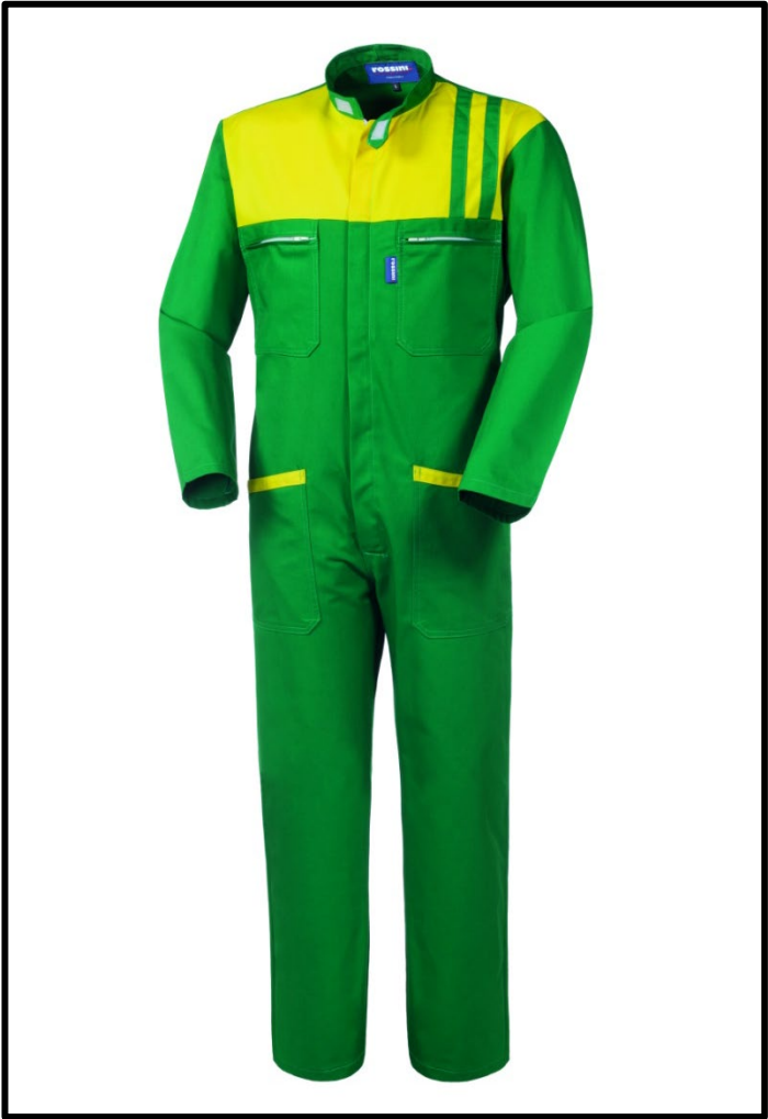
20 – VERDE/GIALLO

Il margine di tolleranza produttivo, nel rispetto delle dimensioni della taglia, può essere del +/- 3%