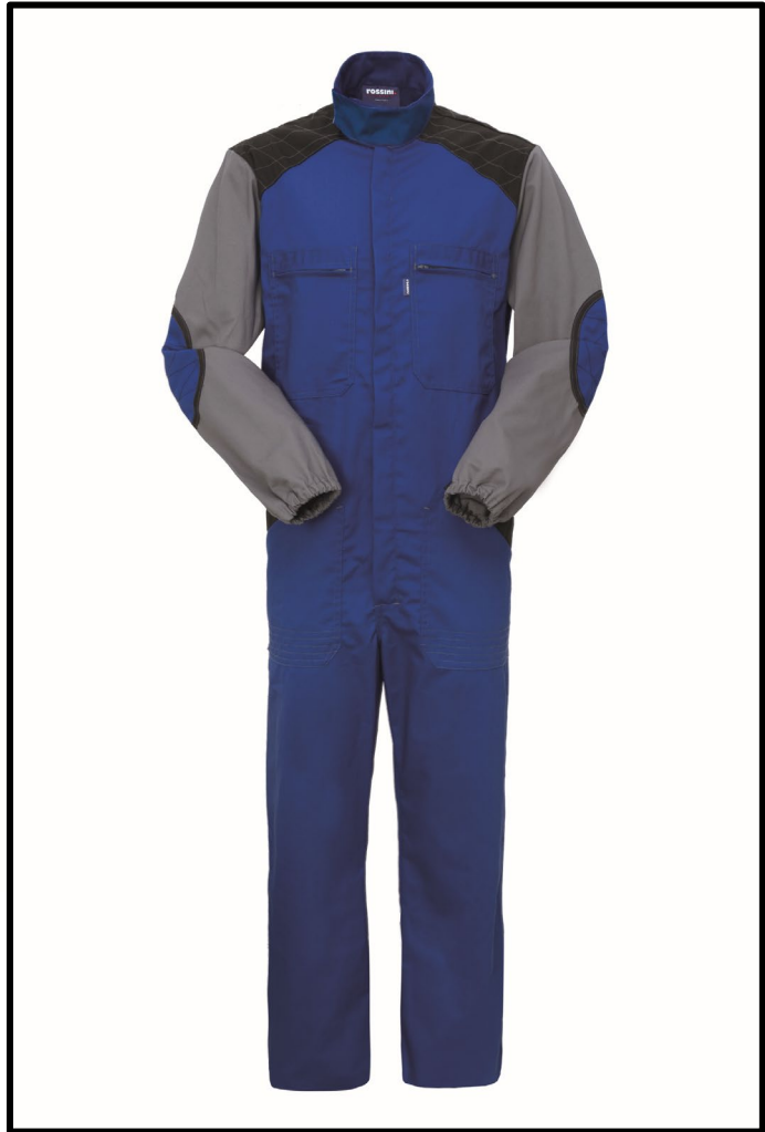
AG – AZZURRO ROYAL/GRIGIO

Il margine di tolleranza produttivo, nel rispetto delle dimensioni della taglia, può essere del +/- 3%