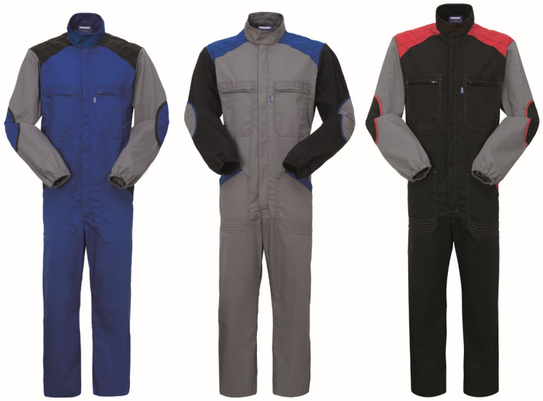
AG – AZZURRO ROYAL/GRIGIO GY – GRIGIO/NERO ZY – NERO/GRIGIO